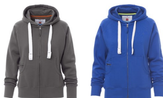
GRIGIO SMOKE BLU ROYAL