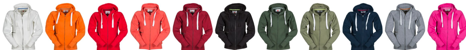
BIANCO ARANCIONE ROSSO HOT CORAL BORDEAUX NERO VERDE VERDE ARMY BLU NAVY GRIGIO MELANGE FUXIA