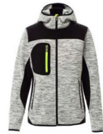
GRIGIO MELANGE /NERO-GIALLO FLUO