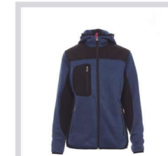
BLU MELANGE/NE RO-FUXIA FLUO