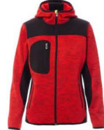
ROSSO/NERO- GIALLO FLUO