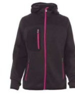
STEEL GREY MELA NGE/NERO-FUXIA FLUO