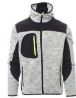
GRIGIO MELANGE /NERO-GIALLO FLUO