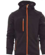
STEEL GREY MELANGE/NERO-ARANCIONE NEON