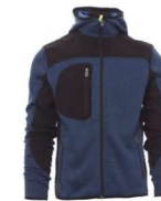
BLU MELANGE/NE RO-GIALLO FLUO