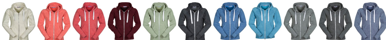
BIANCO MELANGE HOT CORAL MELANGE ROSSO MELANGE BORDEAUX MELANGE VERDE ARMY MELANGE NERO MELANGE BLU ROYAL MELANGE SUGAR BLUE MELANGE STEEL GREY MELANGE GRIGIO CENERE MELANGE BLU NAVY MELANGE