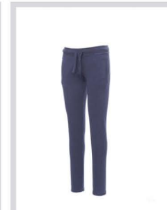
LIGHT DENIM MELANGE