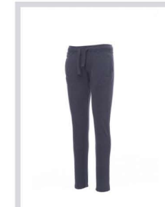
BLU DENIM MELANGE