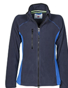
BLU NAVY/BLU ROYAL