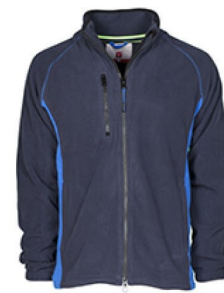
BLU NAVY/BLU ROYAL