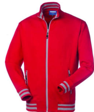
07 – ROSSO