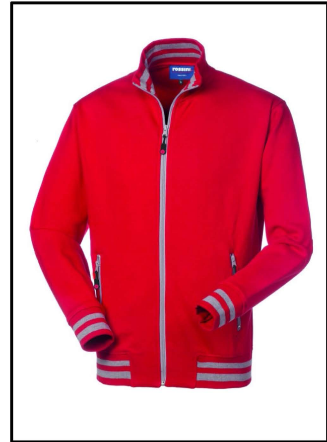
07 – ROSSO