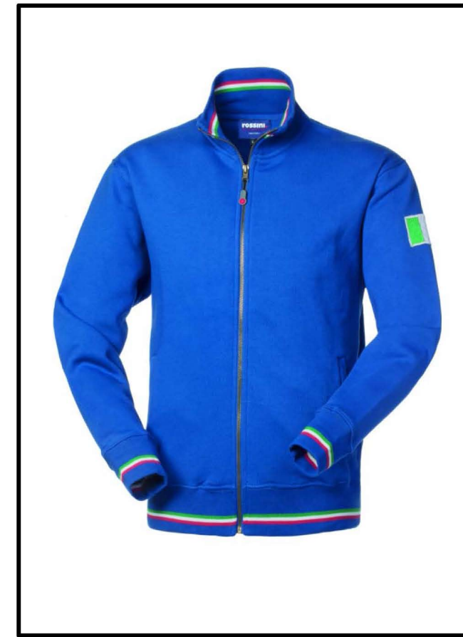
06 – AZZURRO ROYAL