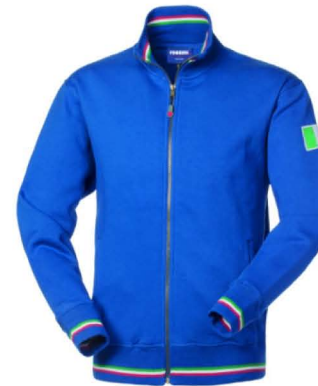
06 – AZZURRO ROYAL