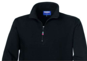
05 – NERO

Felpa con collo alto chiuso con cerniera corta, parasudore interno al collo, polsi e fascia girovita in maglia elastica.