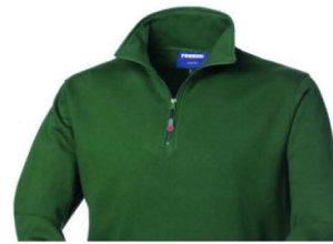
04 – VERDE