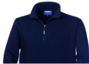
01 – BLU