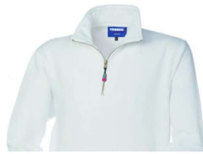
02 – BIANCO