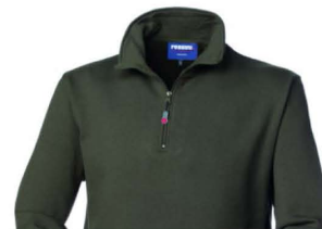
10 – OLIVA ARMY GREEN

S, M, L, XL, XXL, XXXL, 4XL, 5XL XS solo per 02 bianco