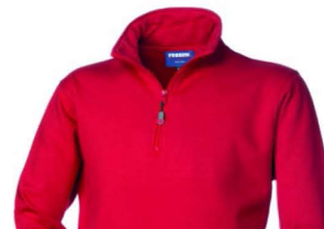
07 – ROSSO