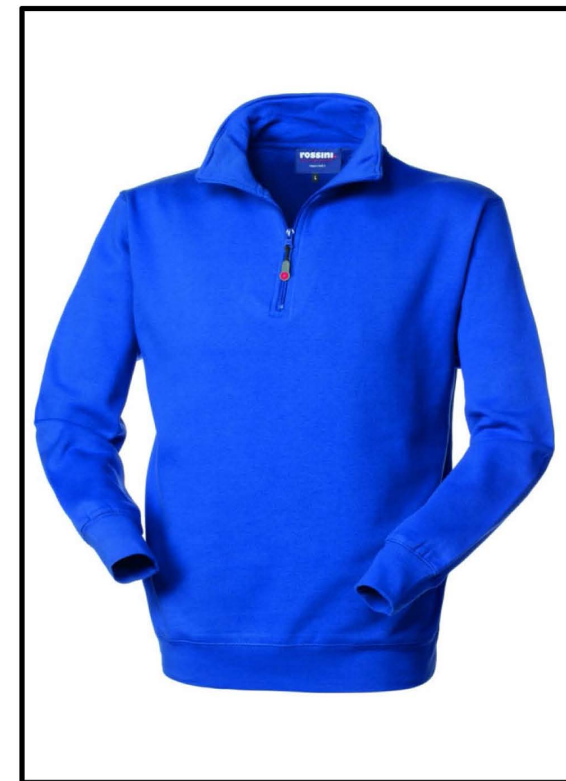
06 – AZZURRO ROYAL