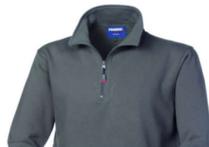
12 – GRIGIO