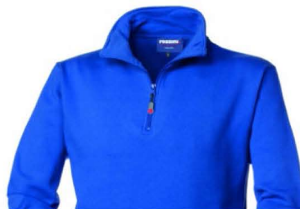
06 – AZZURRO ROYAL