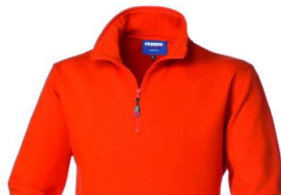
09 – ARANCIO

80% cotone 20% poliestere Peso 290 g/m 2 Con garzatura