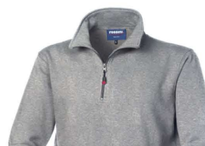
G6 – GRIGIO MELANGE