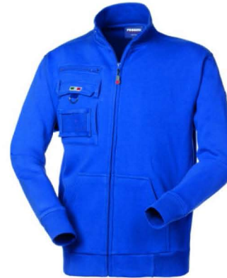
06 – AZZURRO ROYAL