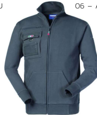
12 – GRIGIO