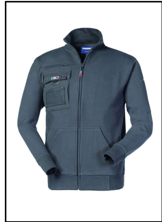
12 – GRIGIO