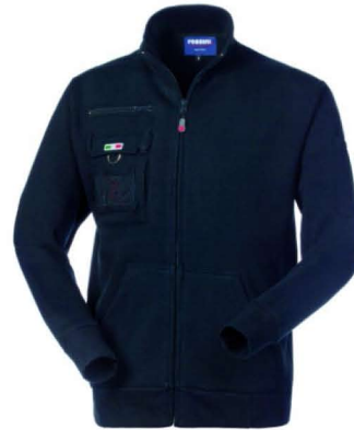
01 – BLU