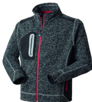
12 - GRIGIO