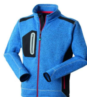
06 - AZZURRO ROYAL