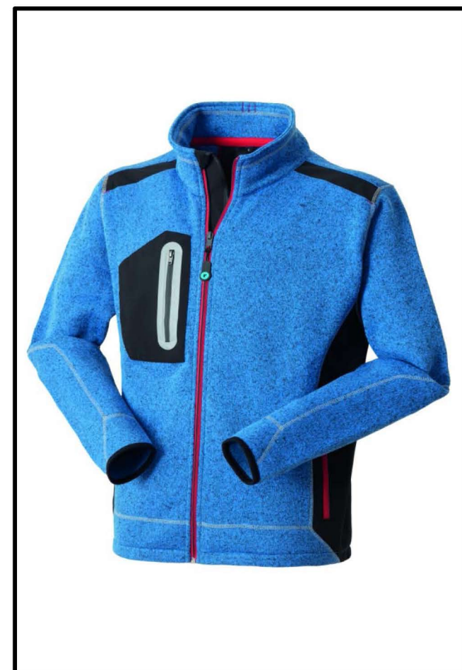
06 - AZZURRO ROYAL