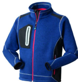
01 - BLU

Fascia in vita interna in maglia elastica, cuciture e travette a contrasto.