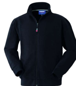
05 – NERO