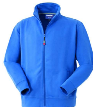
06 – AZZURRO ROYAL